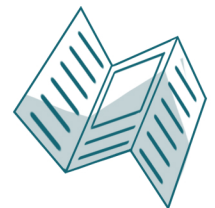
Fiche de solution