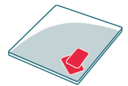
Plateau de jeu